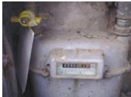
chiusura effettuata (foto numeratore e foto contatore sigillato)